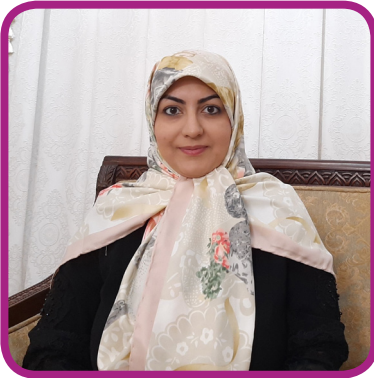
ثنا کشمیری (مدرسه پسرانه)

تابستان بود. چند ماهی به شانزده سالگی ام مانده بود که برای اولین بار معلمی را تجربه کردم. یک شوق عجیبی برای معلم شدن داشتم. این، شروعی بی نظیر برای یک راه طولانی بود. تدریسم فراز و نشیب‌های جالبی داشت. گاهی برایش به آسیای دور رفتم. گاهی ساعت‌ها رانندگی کردم تا به منزلگاه